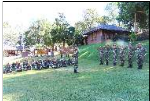
“No Gift Policy ทส. โปร่งใสและเป็นธรรม”