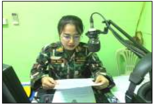
“No Gift Policy ทส. โปร่งใสและเป็นธรรม”