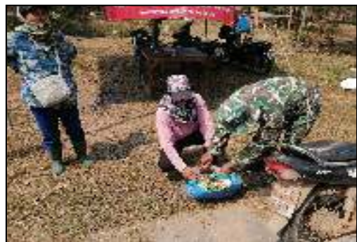
“No Gift Policy ทส. โปร่งใสและเป็นธรรม”