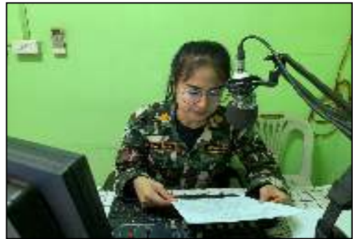
“No Gift Policy ทส. โปร่งใสและเป็นธรรม”