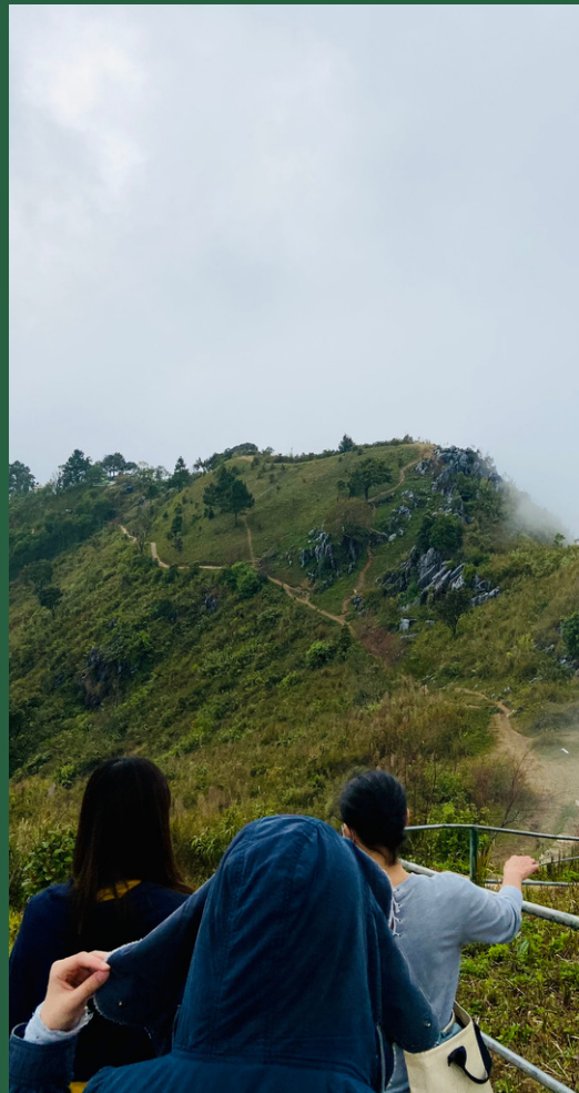
ฝ่ายแผนงานและติดตามประเมินผล สำนักบริหารพื้นที่อนุรักษ์ที่ 15 (เชียงใหม่)