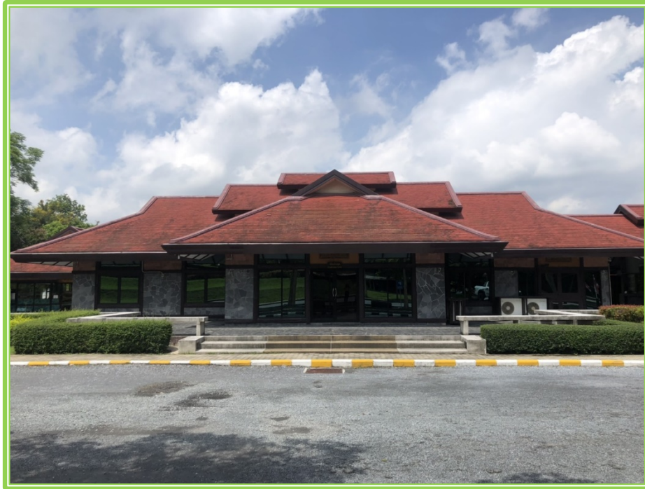
ภาพห้องประชุมศูนย์ฝึกอบรมที่ ๖ (เจ็ดคต - โป่งก้อนเส้า)