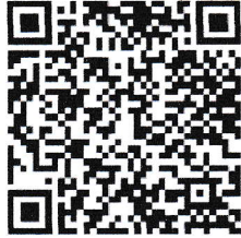
ร่างแผนการอนุรักษ์และคุ้มครองพื้นที่ เขตห้ามล่าสัตว์ป่าหนองเล็งทราย

๓. ประชาชน มีองค์ความรู้และเกิดความตระหนักถึงความสำคัญของทรัพยากรธรรมชาติที่มีในพื้นที่เพื่อดำรงรักษาไว้ซึ่งทรัพยากรธรรมชาติและความหลากหลายทางชีวภาพอย่างสมดุลและยั่งยืน