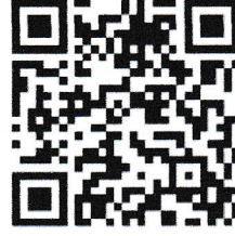
แบบสำรวจความคิดเห็น